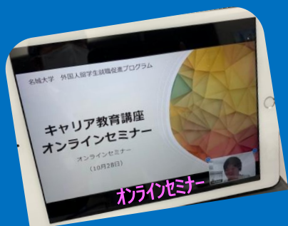
オンラインセミナー